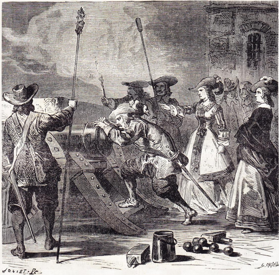
Mademoiselle à la Bastille (1652).

Le parlement accepta cette déclaration de guerre et enrôla pour chefs des princes et de jeunes seigneurs qui se firent frondeurs pour faire pièce à celui qu'ils appelaient dédaigneusement Mons Mazarin .